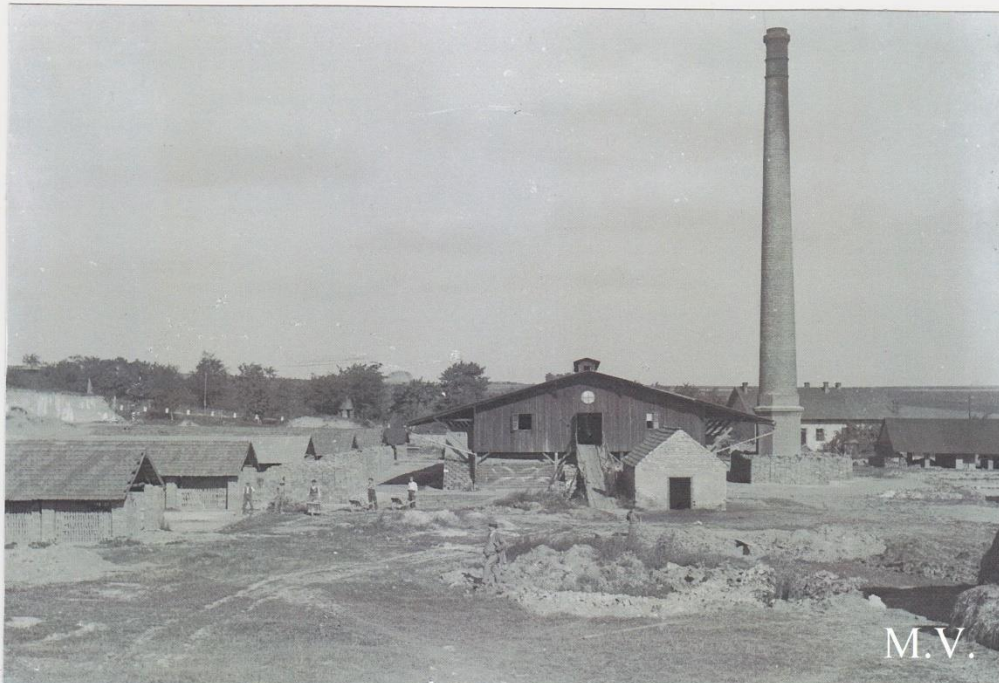
Po rekonstrukci po požáru